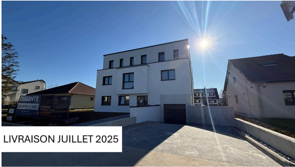
LIVRAISON JUILLET 2025